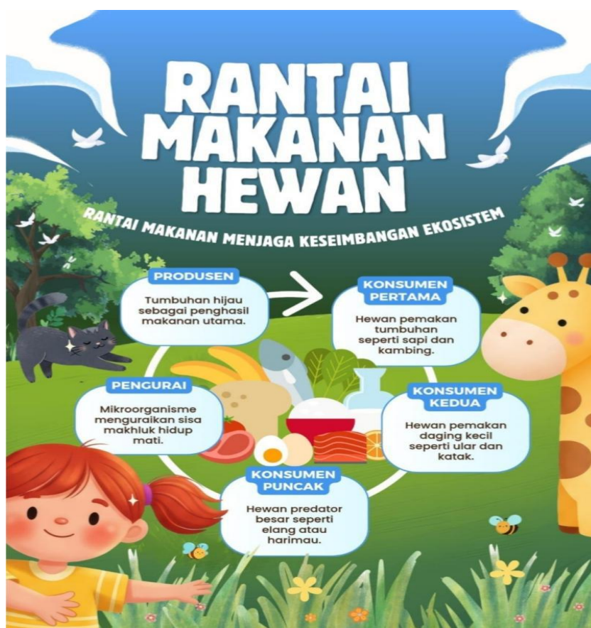
Gambar 1. Video Materi Rantai Makanan (Kementerian Pendidikan, 2021)

Kelebihan pembelajaran dengan menggunakan media animasi ini, menurut pengalaman peneliti yaitu untuk meningkatkan kemampuan berpikir kritis siswa sehingga memudahkan peneliti menyiapkan media karena hanya menggunakan proyektor. Dengan ini siswa dapat berpikir kritis, berkolaborasi,