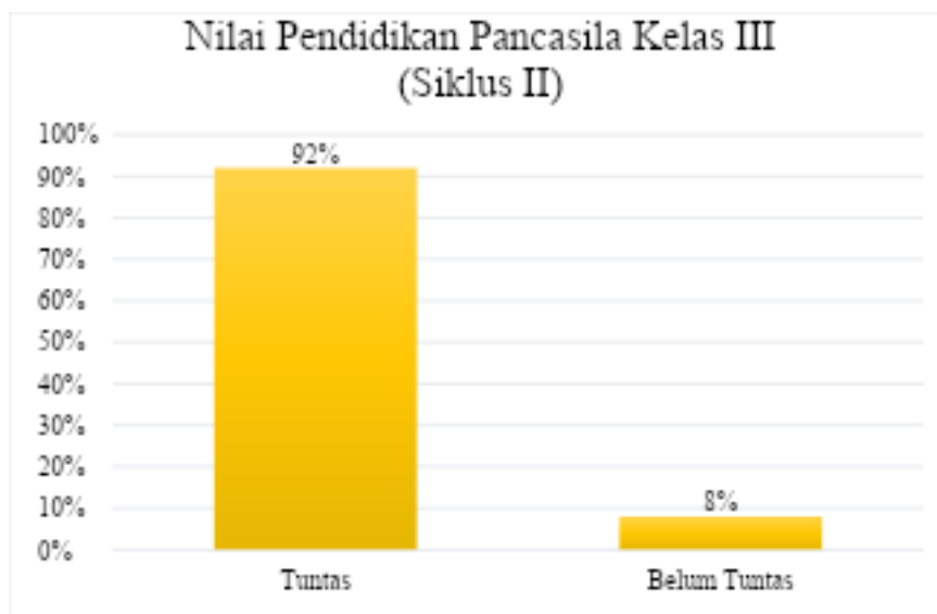
Gambar 2. Diagram Hasil Belajar Siklus II.

Pada siklus II persentase hasil belajar siswa sudah mencapai ketuntasan, adapun hasil yang diperoleh pada siklus II ini telah mencapai hasil yang diharapkan. Berdasarkan data tersebut menunjukkan bahwa siswa di SDN 9 Limboto mampu memahami pembelajaran Pendidikan Pancasila materi aturan di sekolahku, dalam proses pembelajaran juga meningkat sehingga model discovery learning dapat dikatakan berhasil dalam meningkatkan hasil belajar dan kendala-kendala yang dialami siklus I sudah dapat diatasi dengan baik. Hal ini disebabkan karena peneliti telah mengadakan perbaikan terhadap kesalahan-kesalahan yang terjadi pada siklus I sesuai dengan kebutuhan siswa dan saran yang telah diberikan oleh guru kolaborator yang selama ini selalu mengikuti dan mendampingi ketika proses penelitian yang dilakukan oleh peneliti.